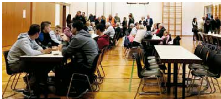
Blackout-Übung in Eberstein im September 2022