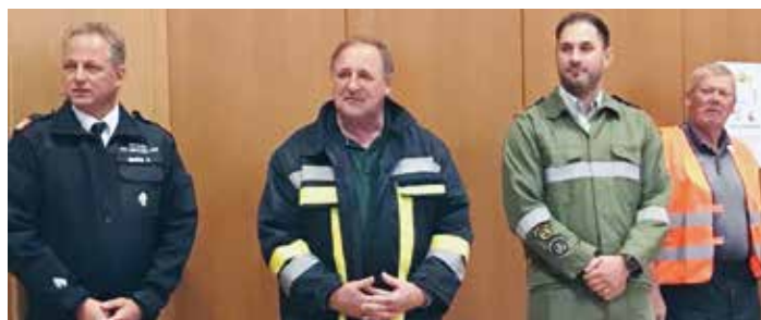
Bürgermeister, Feuerwehr und Bezirksfeuerwehrkommandant bei der Blackout-Übung