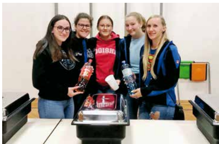
Landjugend unterstützt bei der Blackout-Übung

Sollten Sie die Blackout-Infoveranstaltung verpasst haben, gibt es am 18.01.2023, um 19 Uhr, im Gemeindeamt Klein Sankt Paul die Möglichkeit die Informationsveranstaltung „ Blackout-Vorsorge für Privathaushalte “ zu besuchen. Der Zivilschutz-Bezirksleiter GR Horst Maier erzählt Ihnen im ersten Teil der Veranstaltung, was genau ein Blackout ist und wie Sie zu Hause vorsorgen können. Im zweiten Teil stellen Klein Sankt Paul und Wieting ihre aktuelle Strategie zur Blackout-Vorsorge vor. Nach dem Informationsvortrag können noch offene Fragen gestellt und Unsicherheiten geklärt werden.