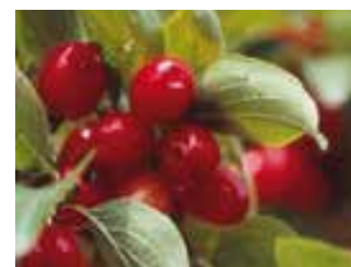
Früchte für Mensch und Tier