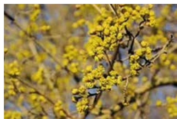
Kornelkirsche: Frühes Bienenfutter

gefressen. Die länglichen, glänzenden Früchte mit viel Fruchtsäure, einem hohen Gehalt an Vitamin C und Fruchtzucker sind aber auch für den Menschen nutzbar. Aus ihnen lässt sich ein schmackhafter Süßmost herstellen oder Fruchtmus herstellen.