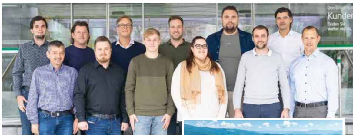
Das Projektteam der Kärnten Netz bedankt sich bei allen Beteiligten für die konstruktive Zusammenarbeit.

Die Planungsarbeiten der Kärnten Netz für den Bau der neuen, leistungsstarken 110-kV-Freileitung in Mittelkärnten treten in die finale Phase. Das Projekt steht kurz vor der Einreichung der Umweltverträglichkeitserklärung (UVE), welche im ersten Quartal 2025 erfolgen wird. Mit diesem Schritt wird der Umweltverträglichkeitsprüfungsprozess (UVP) eingeleitet.