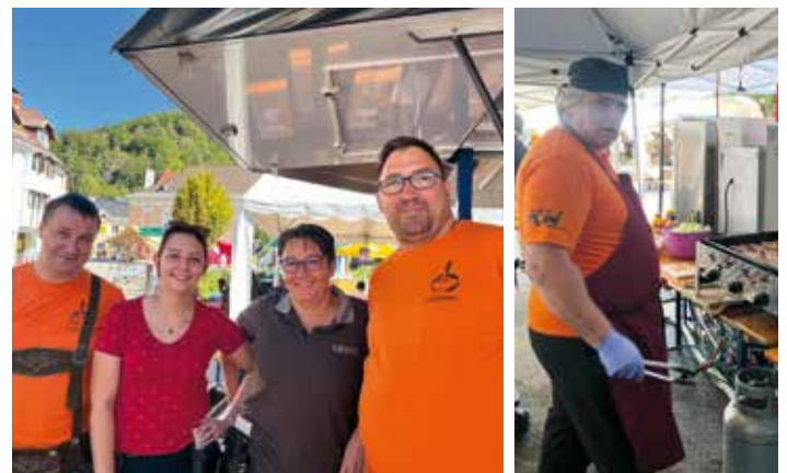
Der Eisstockverein Eberstein dankt für Euren Besuch am Heimatherbst!