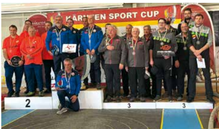
Kärnten Sport Cup 2025 - Ein Stocksport-Fest voller Emotionen!